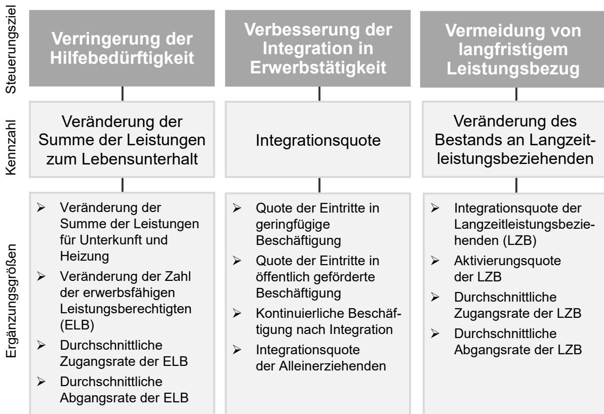
Abbildung 1: Zielsystem mit Kennzahlen und Ergänzungsgrößen

In Verbindung mit § 48a Absatz 2 SGB II und der Verordnung zur Festlegung der Kennzahlen nach § 48a SGB II ergibt sich ein Zielsystem, das durch Kennzahlen und Ergänzungsgrößen abgebildet wird. Die Kennzahlen bilden dabei die Grundlagen für die Zielwerte in den Zielvereinbarungen. Die Ergänzungsgrößen dienen der ergänzenden Information und der Interpretation der Kennzahlenergebnisse (vgl. § 2 Absatz 1 Satz 3 der Verordnung zur Festlegung der Kennzahlen nach § 48a SGB II - Kennzahlen - VO).