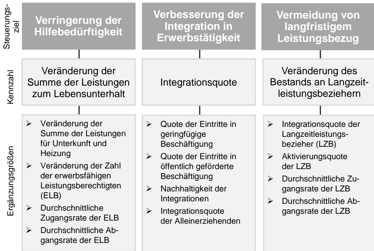
Abbildung 1: Zielsystem mit Kennzahlen und Ergänzungsgrößen

Darüber hinaus sind grundsätzlich weitere Vereinbarungen über Ziele zwischen den in den §§ 48b Absatz 1 Satz 1 und 18b Absatz 1 Satz 1 SGB II genannten Beteiligten möglich. Dabei soll bei einer über eine qualitative Beschreibung des Ziels hinausgehenden Vereinbarung eine geeignete Datengrundlage für die Zielvereinbarung und -nachhaltung durch die Vereinbarungspartner bestimmt werden.