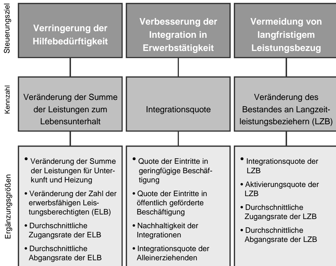
Abbildung 1: Zielsystem mit Kennzahlen und Ergänzungsgrößen

Kennzahlenergebnisse (vgl. § 2 Absatz 1 Satz 3 der Verordnung zur Festlegung der Kennzahlen nach § 48a SGB II).