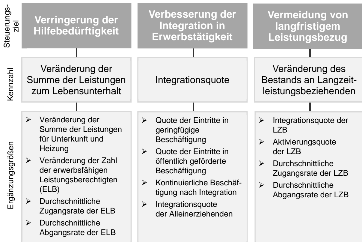
Abbildung 1: Zielsystem mit Kennzahlen und Ergänzungsgrößen

In Verbindung mit § 48a Absatz 2 SGB II und der Verordnung zur Festlegung der Kennzahlen nach § 48a SGB II ergibt sich ein Zielsystem, das durch Kennzahlen und Ergänzungsgrößen abgebildet wird. Die Kennzahlen bilden dabei die Grundlagen für die Zielwerte in den Zielvereinbarungen. Die Ergänzungsgrößen dienen der ergänzenden Information und der Interpretation der Kennzahlenergebnisse (vgl. § 2 Absatz 1 Satz 3 der Verordnung zur Festlegung der Kennzahlen nach § 48a SGB II - Kennzahlen - VO).