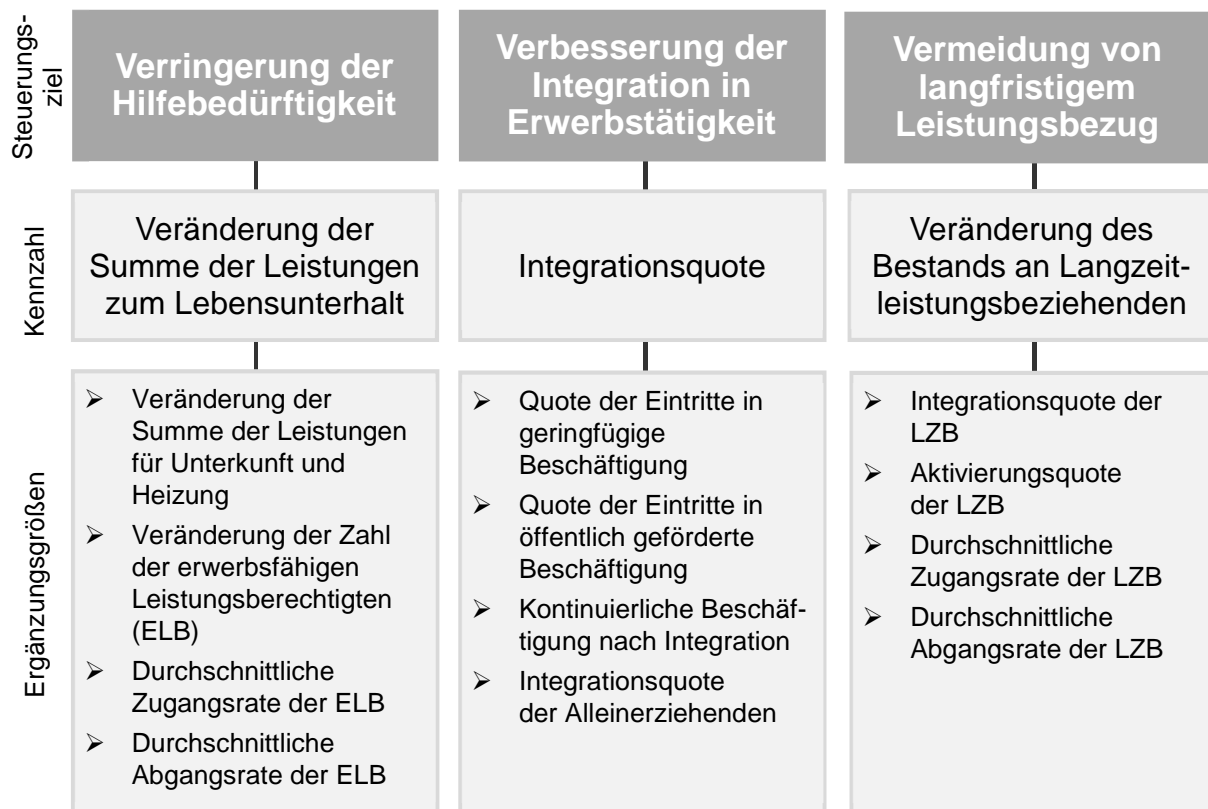
Abbildung 1: Zielsystem mit Kennzahlen und Ergänzungsgrößen

In Verbindung mit § 48a Absatz 2 SGB II und der Verordnung zur Festlegung der Kennzahlen nach § 48a SGB II ergibt sich ein Zielsystem, das durch Kennzahlen und Ergänzungsgrößen abgebildet wird. Die Kennzahlen bilden dabei die Grundlagen für die Zielwerte in den Zielvereinbarungen. Die Ergänzungsgrößen dienen der ergänzenden Information und der Interpretation der Kennzahlenergebnisse (vgl. § 2 Absatz 1 Satz 3 der Verordnung zur Festlegung der Kennzahlen nach § 48a SGB II - Kennzahlen - VO).